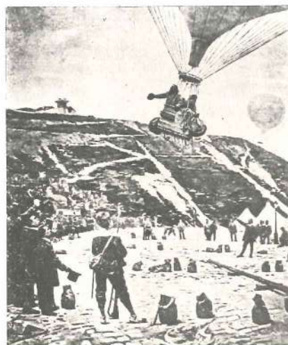
Asedio de París (1870). Un globo parte para llevar la correspondencia de la ciudad a las provincias.

El experimento de Allahabad sirvió de ejemplo, en los años siguientes, para muchos otros vuelos postales; pero se necesitarían aún seis años para que alguien tuviera la idea de crear sellos destinados únicamente a franquear el «correo aéreo». Esta idea fue italiana. En 1917, en plena guerra