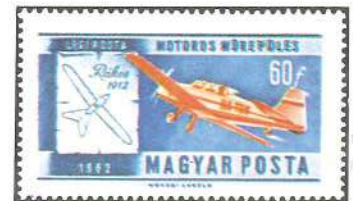
Algunos ejemplares modernos seleccionados en una colección de sellos para correo aéreo. Perú 1967, Estados Unidos 1946 (los Estados Unidos emitieron el primer sello de correo aéreo en 1918), Marruecos 1967 y Hungría 1962.