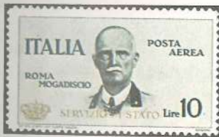
Abajo: Italia 1934, sello creado para franquear algunas cartas oficiales de Roma a Mogadiscio por vía aérea.

cial. Estos sellos «publicitarios» —que ahora ya son poco comunes— en general tuvieron una vida breve: los italianos desaparecieron cuando se incurrió en la osadía de imprimir una viñeta que representaba una pareja de enamorados, que se besaban a la sombra de la efigie del rey, impresa en la parte superior del sello. Francia, en cambio, escandalizó a todo el mundo cuando bajo la efigie de Juana de Arco triunfante en Orleans permitió que se agregara una viñeta publicitaria del queso La vache qui rit , una marca poco acorde con la seriedad del tema. El tema de los enamorados apareció también en dos sellos que emitió Checoslovaquia en 1973, pensando específicamente en las parejas de novios: agregando estos sellos especiales al franqueo normal se conseguía que el cartero entregara la carta sólo en mano del destinatario, evitando así extravíos.