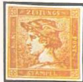
Marca para periódicos emitida por el Ducado de Parma en 1853 y el poco corriente sello austriaco para periódicos; tiene estampada la cabeza de Mercurio y fue emitido en cuatro colores: azul, amarillo, rojo y rosa. El rojo, reproducido aquí, es el más raro.